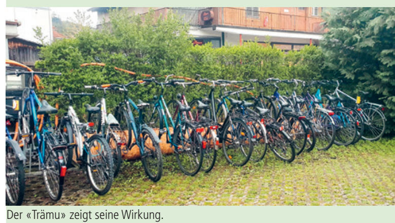
Der «Trämu» zeigt seine Wirkung.

Viele der Bewohnenden der Kollektivunterkunft treffen wir auf der Strasse oder in den Einkaufszentren. Die Gesichter kommen uns langsam bekannt vor. Um Gesichter der Kollektivunterkunft geht es bei der nächsten Ausstellung im Kunsthaus Steffisburg. Der Bildhauer und Künstler Andreas Wiesmann hat 23 Portraits von Bewohnenden der Unteren Mühle mit der Motorsäge gefertigt. Am Donnerstag, 15. August ab 19 Uhr findet die Vernissage für die Ausstellung Face of Bern im Kunsthaus Steffisburg statt.