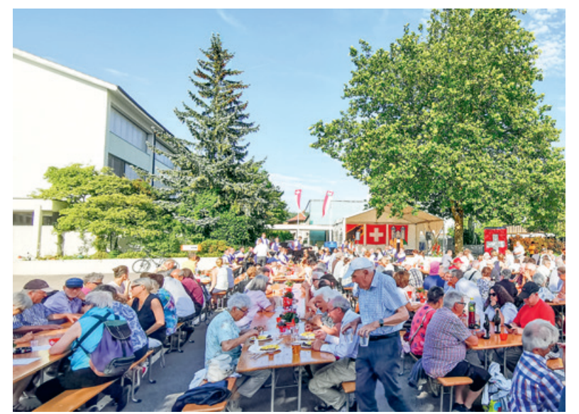
Zufriedene Stimmung und schönes Wetter an der Bundesfeier 2023 in Steffisburg.

– NEU! – Kinderschminken 17.30 – 19.30 Uhr