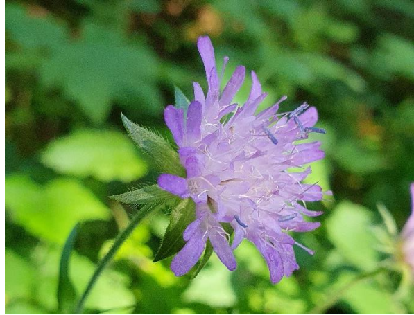
Abbildung 1: Wurmfarne (links) und Wald-Witwenblume (rechts)